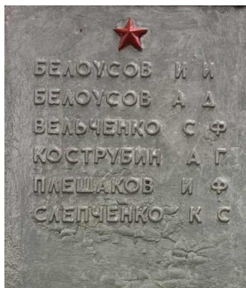
№6 Имена на памятниках