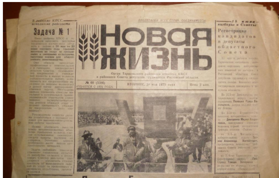
№2 Газета «Новая жизнь»