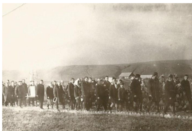
№4 Перезахоронение останков воинов