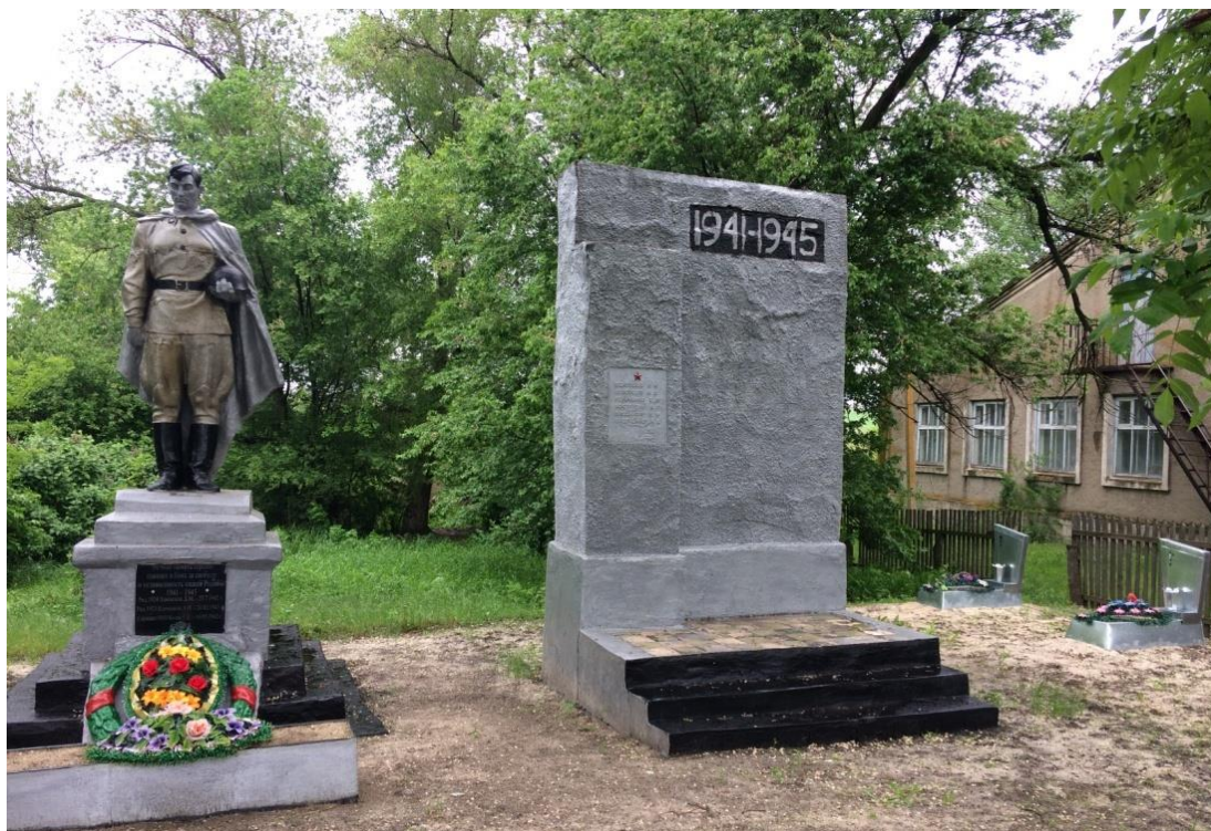
№5 Памятники хутора Новоалексеевка